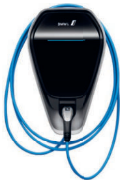
BMW i Wallbox. Cena: 26 958 Kč