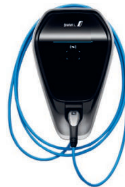
BMW i Wallbox plus. Cena: 29 441 Kč

Nabízí možnost rychlejšího dobíjení spojeného s nejmodernější technologií a maximálním pohodlím při dobíjení – to je nový BMW i Wallbox Plus. Kompatibilní se všemi vozy BMW i a BMW iPerformance.