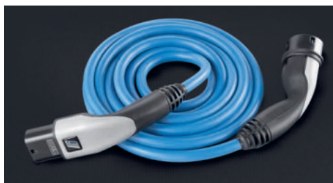
Kabel pro rychlé dobíjení a brašna na kabel. Cena: 8 912 Kč

Kabel pro rychlé dobíjení umožňuje až třikrát rychlejší dobíjení na veřejných dobíjecích stanicích – v závislosti na místní elektrické infrastruktuře – a díky jeho spirálové konstrukci se velmi snadno používá. Kabel nově podporuje třífázové dobíjení o výkonu až 22 kW. Brašna na kabel ulehčuje každodenní použití – dodávanou utěrku z mikrovlákná je možné použít na otření rukou a kabelu, zavazadlový prostor tak zůstává čistý. Brašna na kabel je vyrobena z voděodolného materiálu z recyklovaných PET lahví; a díky praktickému rolovacímu mechanismu je její použití rychlé a jednoduché.