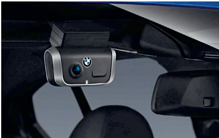
Advanced Car Eye 2.0 Cena bez montáže: 11 615 Kč

BMW Advanced Car Eye 2.0 je vysoce citlivá kamera s rozlišením full HD, jež snímá dění kolem vozu ve dne i v noci. V případě narušení prostoru a mimořádného pohybu okolo vozu kamera automaticky nahraje danou situaci za účelem dokumentace případných poškození nebo vloupání, a to i ve stadiu pokusu. Součástí balení je přední a zadní kamera.