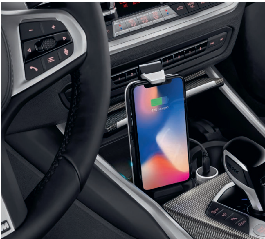
BMW Bezdrátová univerzální nabíjecí stanice Cena: 4 600 Kč

Bezdrátové dobíjení - nabíjete bezdrátově kdekoli zrovna jste. Ať už ve vašem autě, nebo kdekoli jinde. Bezdrátová univerzální nabíjecí stanice je nejrychlejším doplněním bezdrátového nabíjení do vašeho vozu. Sestává ze dvou částí: Základny do držáku nápojů a vyjímatelného modulu s power bankou. Ten umožňuje bezpečné odložení vašeho telefonu a zároveň poskytuje jeho efektivní bezdrátové dobíjení prostřednictvím technologie Qi. Díky vyjímatelnému modulu s integrovanou power bankou je tento produkt ideální pro vaše cesty a umožňuje pokračovat v bezdrátovém nabíjení telefonu i po vystoupení z vozu.